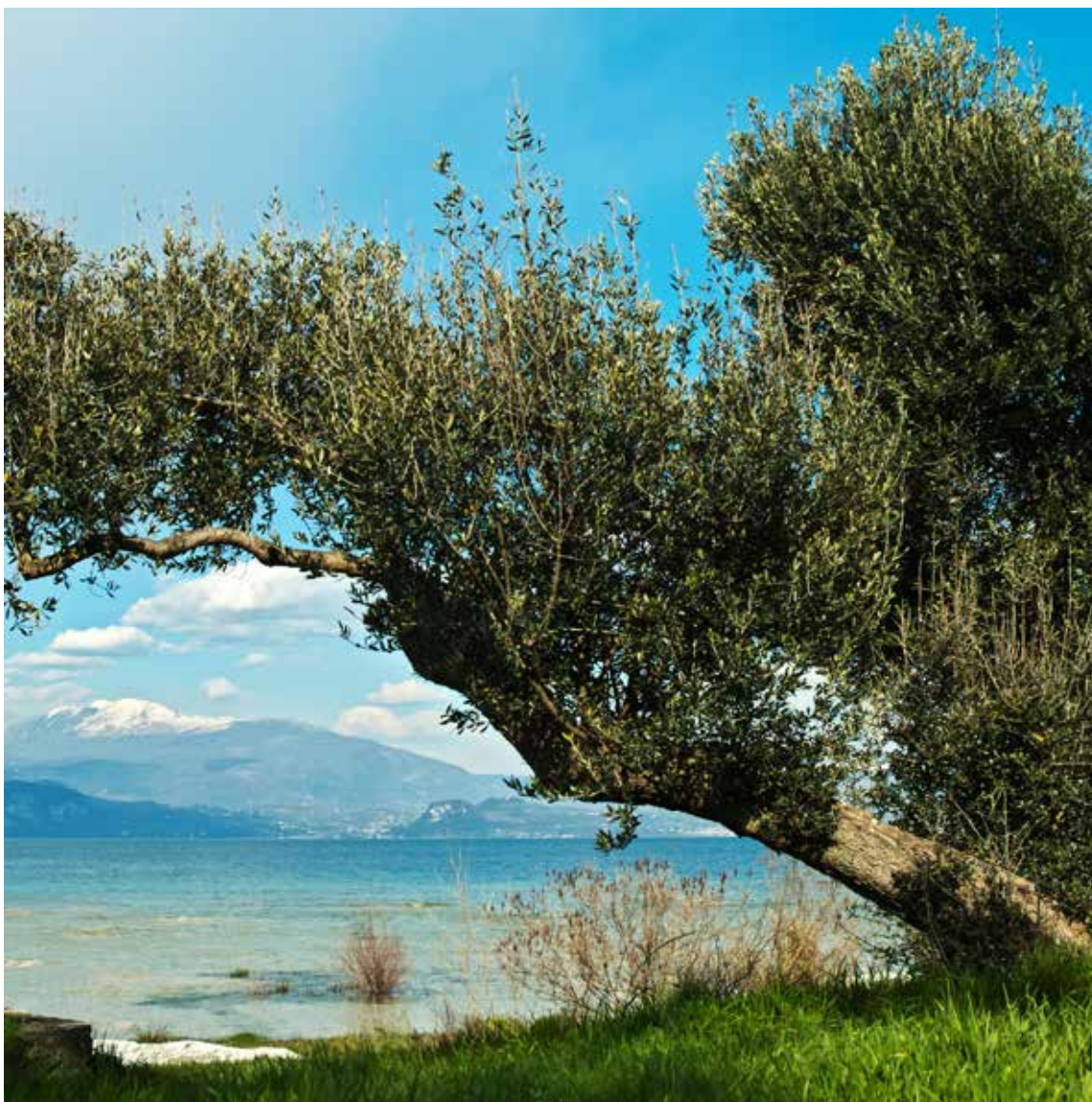
Olive ed Ulivi sul Lago di Garda - Lago di Garda Bresciano