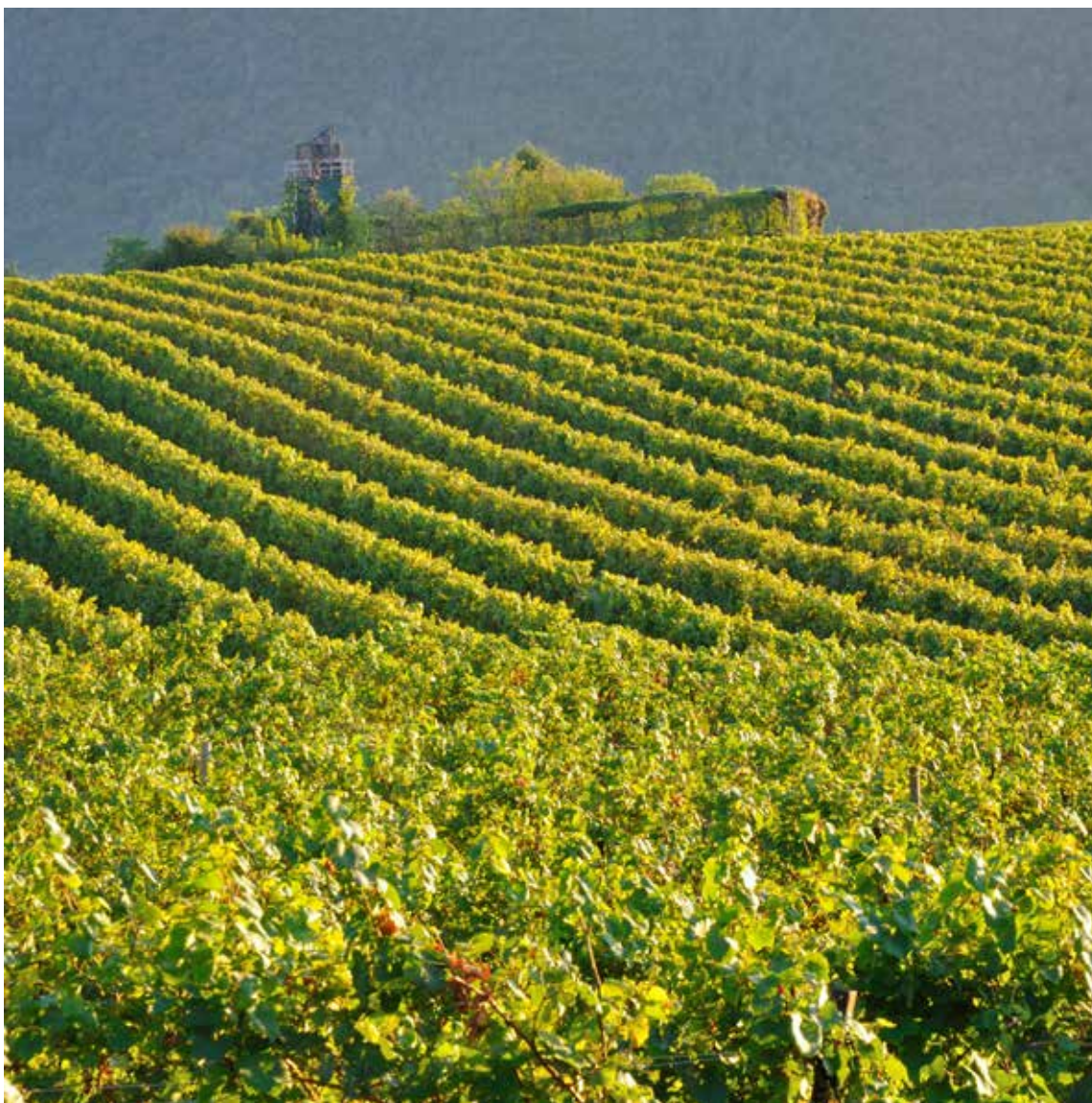
Vigneti della Franciacorta - Zona Lago d'Iseo Brescia