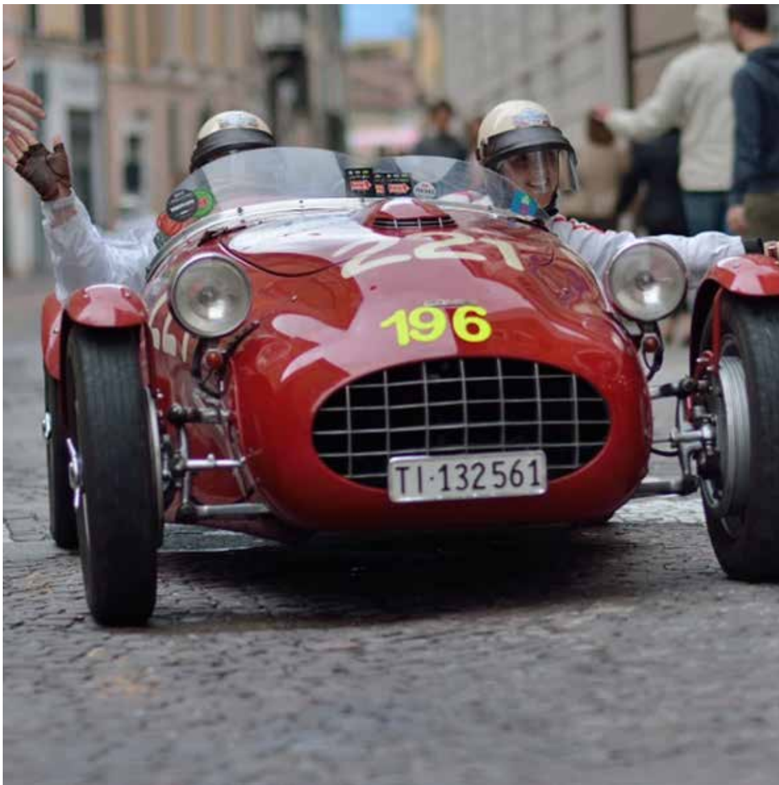
La Mille Miglia - C.so Zanardelli Brescia Centro