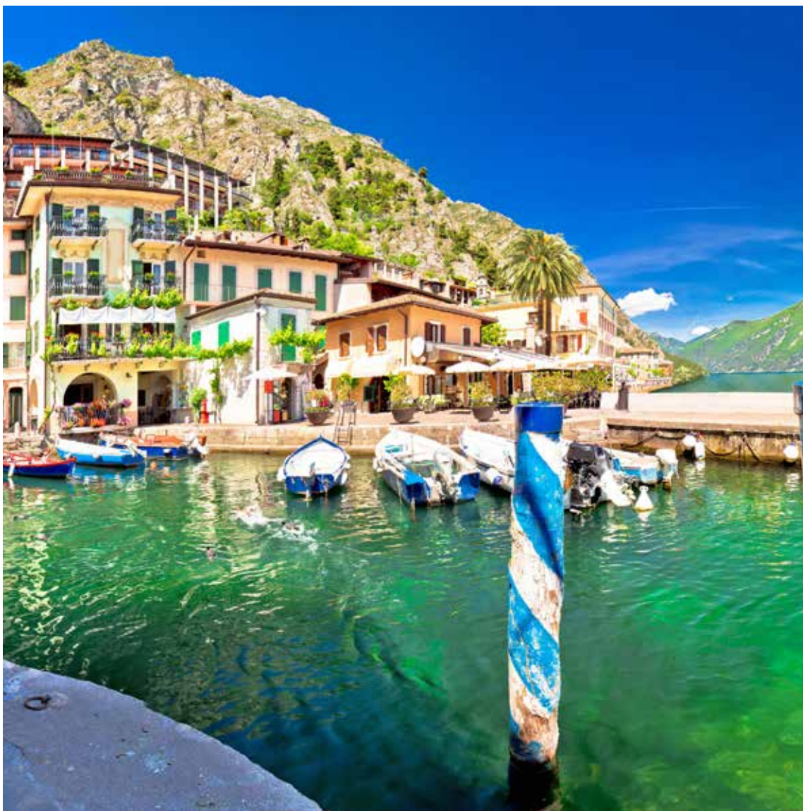
Porticciolo di Limone sul Garda - Lago di Garda Bresciano