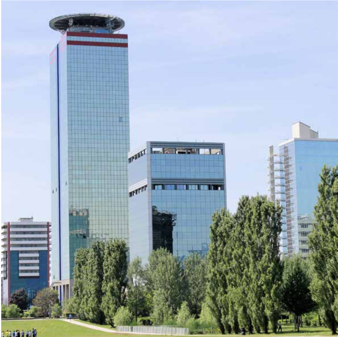
Grattacieli - Zona Brescia 2