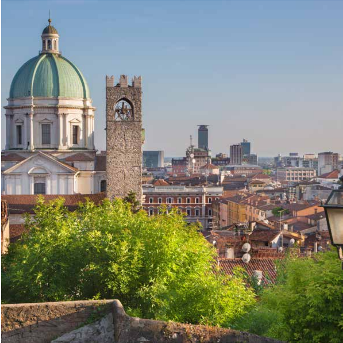
Vista dal Castello di Brescia - Panoramica